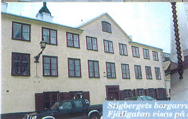
Stigbergets borgarrum på Fjällgatan visas på söndagar.

På Fjällgatan 34 i Stockholm, på Söders höjder med underbar utsikt över Saltsjön, ligger ett vackert tvåvåningshus som rymmer ett av Stockholm mer okända miljöer: Stigbergets Borgarrum.