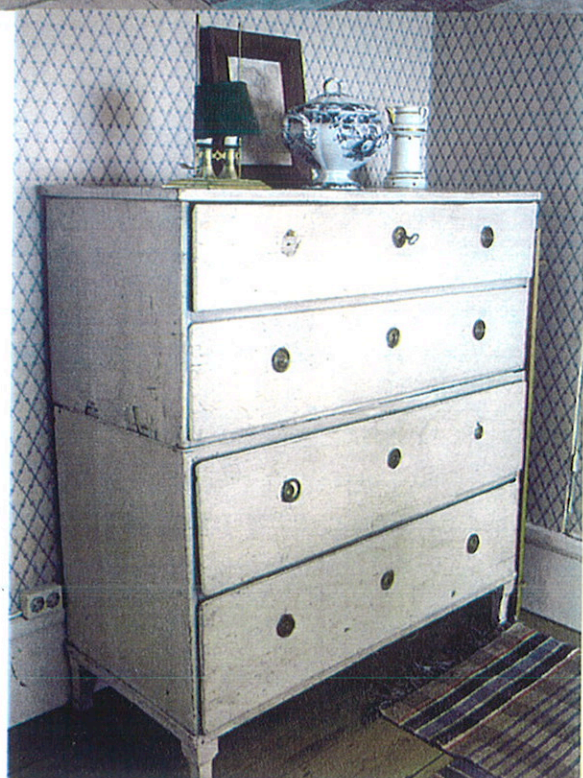
Byrån har troligen tillhört Anna Lindhagens moster. Ovanpå står en soppterrin, en kaffekanna och en ljusplåt med skärm av mässing.

1929 fick Anna möjlighet att hyra en våning på Fjällgatan i Stockholm och hon bodde här fram till sin bortgång 1941. Här samlade hon sina vänner omkring sig och ordnade olika typer av soaréer, med litterära uppläsningar samt med musik. I hennes rum samlades många intellektuella och konstnärer. Hon tog även hem flyktingar och hjälpbehövande.